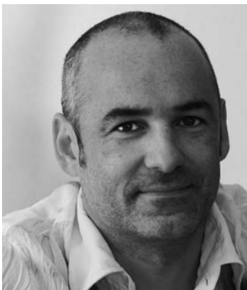
vivida produktdesign by rainer bachschmidt

boxbergweg 4 66538 neunkirchen tel.: 06821/2908-0 fax: 06821/2908-290 mail: info@viasit.com www.viasit.com geschäftsführer: werner schmeer alfons weber ag: saarbrücken hrb 91731 sitz: neunkirchen stand: juli 2010